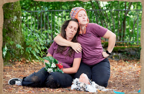
Les Contes de la Pachamama -2023- Festival d'Aurillac