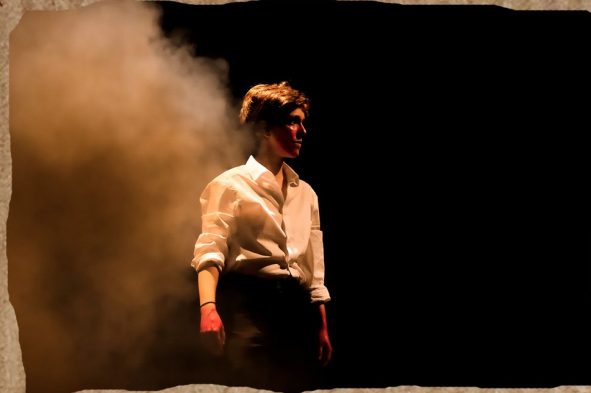
James (seul en scène) -2023- L'Étincelle